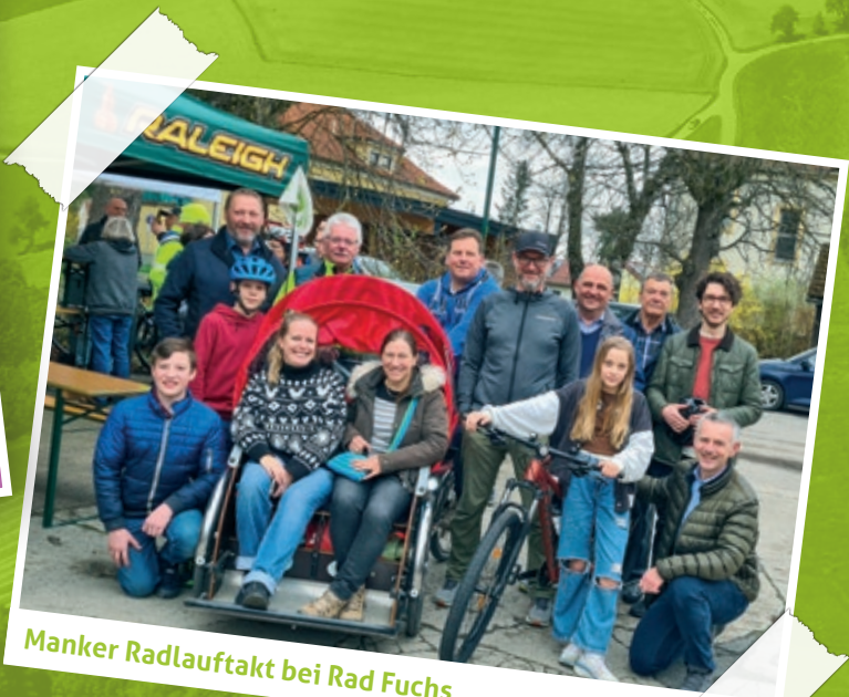
Manker Radlaufakt bei Rad Fuchs