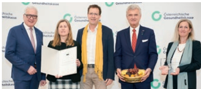
Kerschner Wohndesign - Gütesiegel