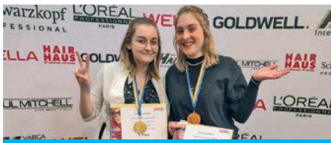
Friseursalon Alex Haargenau - Lehrlingswettbewerb