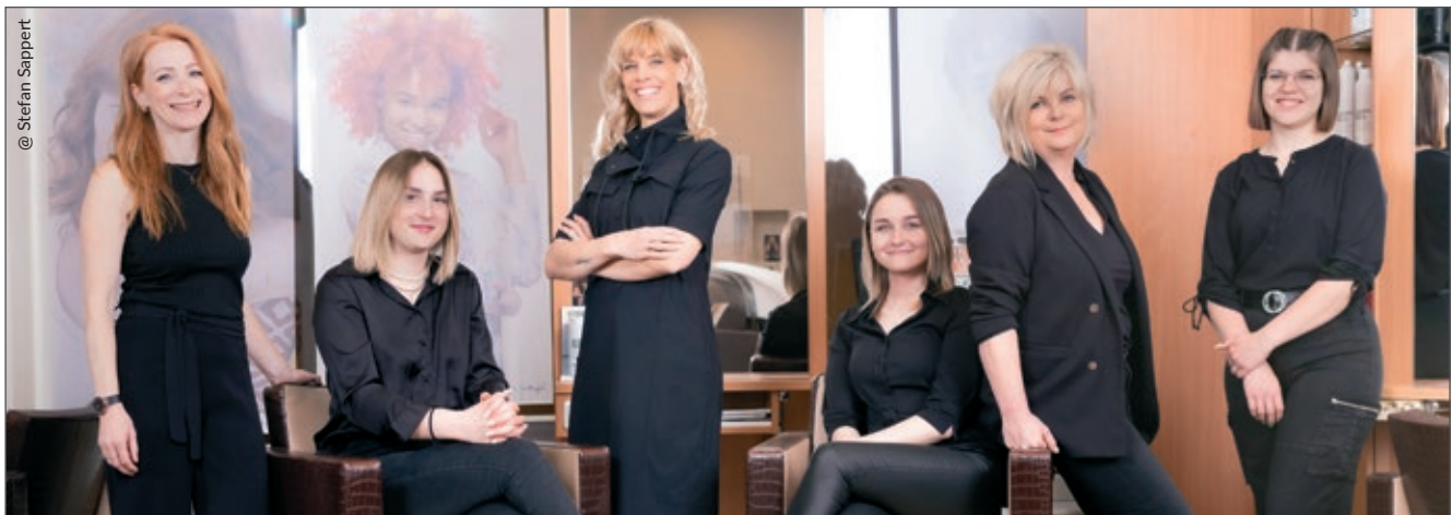
@ Stefan Sappert