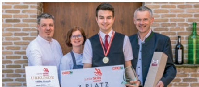
Gasthaus Riedl-Schöner - 3. Platz "Restaurant Service"