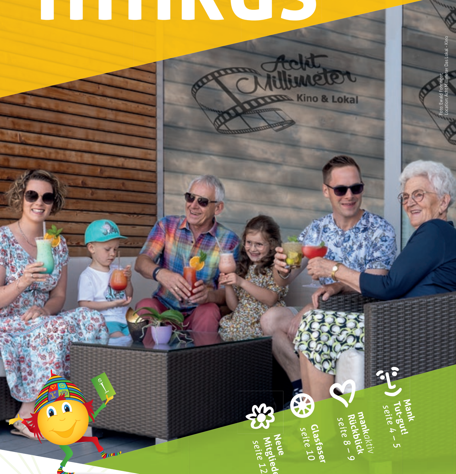
Location: Acht Millimeter Das Lokal - Kino